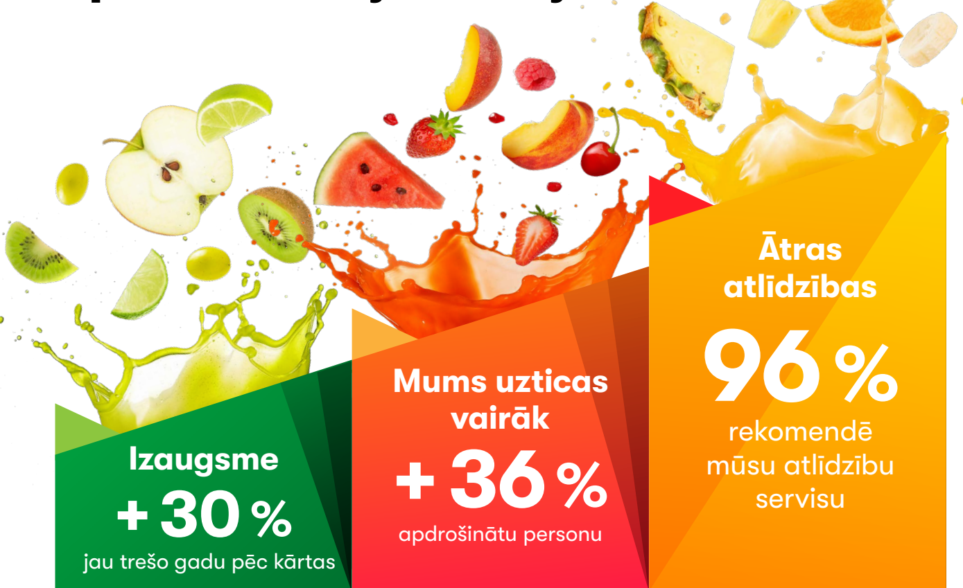
Parakstītās bruto prēmijas